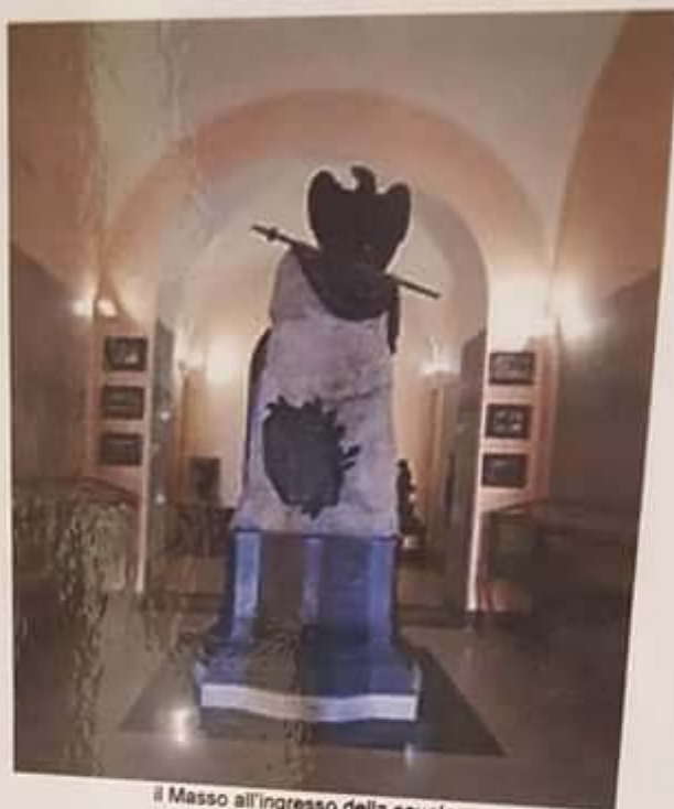
il Masso all'ingresso della scuola