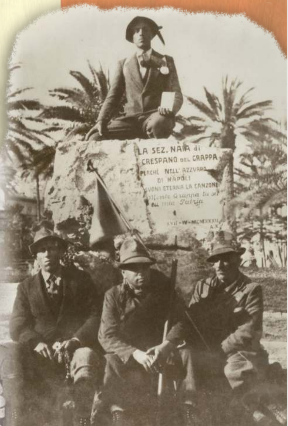
Masso del Grappa donato alla città di Napoli durante l'Adunata del 1932 dagli alpini di Crespano